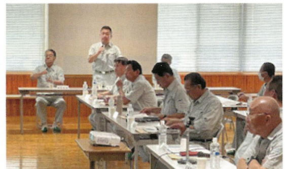
県土整備常任委員会による県内調査