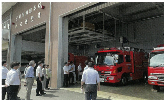
行政視察による現場見学