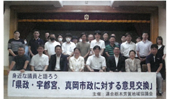
県政報告及び組合員さんとの意見交換会