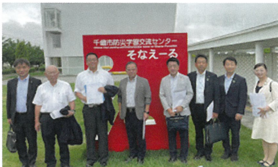
常任委員会での防災施設見学