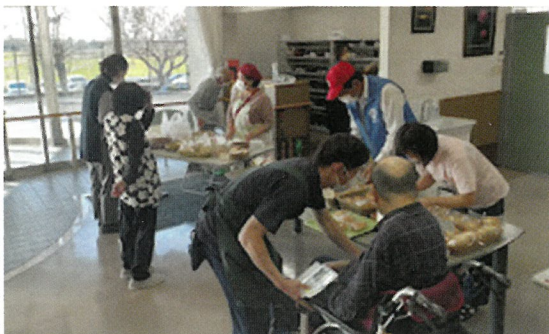
ライオンズクラブ奉仕活動として老人施設でパン販売