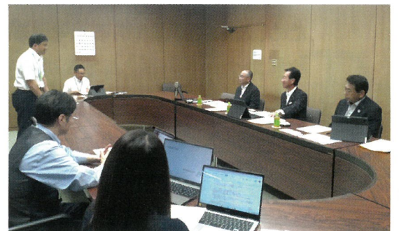
会派による勉強会