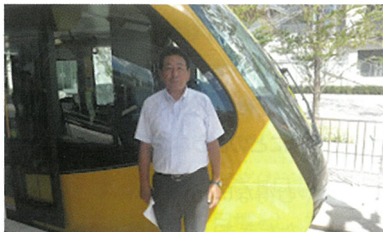
LRT開通前の試乗会参加